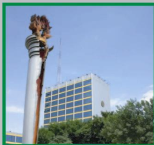
Universidad Autónoma de Nuevo León