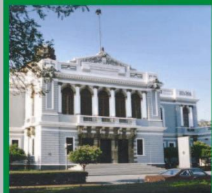
Universidad de Guadalajara